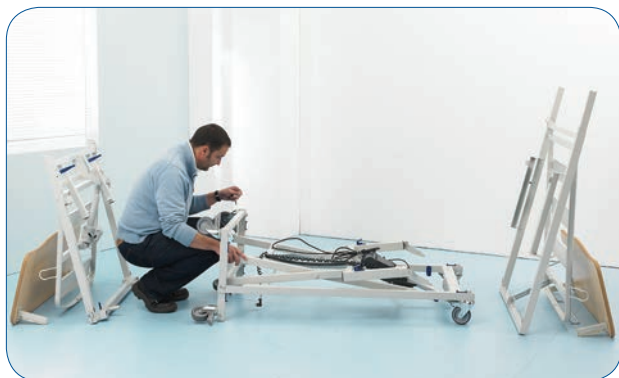
Trasformazione del carrello autoportante in telaio.