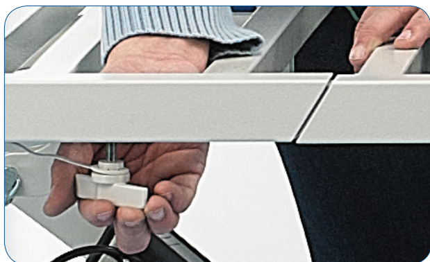
Accoppiamento delle due 1/2 reti con i fissaggi rotondi attraversanti.