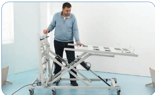
Bloccaggio della 1/2 rete piedi in posizione orizzontale.