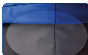
Material antideslizante na parte inferior