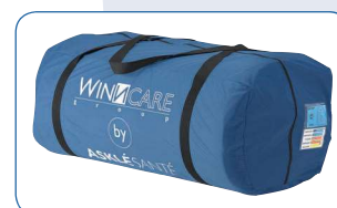
Saco de transporte com identificação do na parte frontal