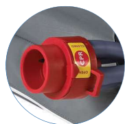
Válvula CPR (Reanimação cardiopulmonar)