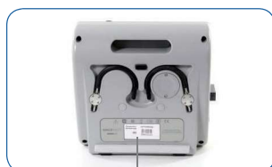
Número de rastreamento no verso compressor (n° série)