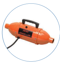
OPÇÃO: Bomba de insuflação rápida