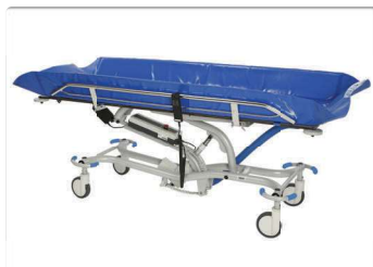
Estrutura metálica em aço inox revestido com epóxi.