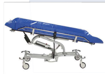
Inclinação de 0° a 10°.