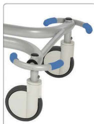
Diâmetro 150 mm.