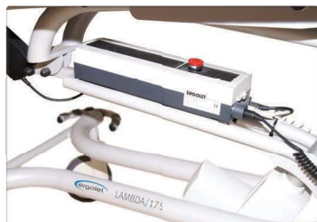
40 ciclos de autonomia. Bateria removível.