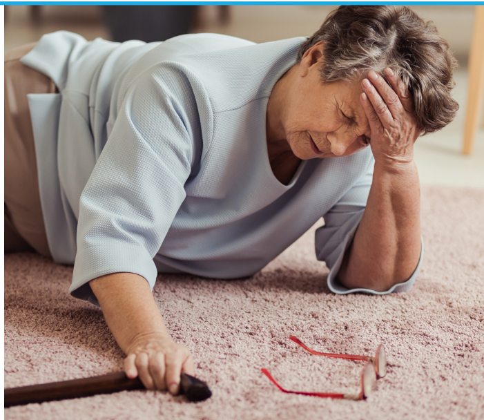
I Danmark falder hver tredje ældre over 65 år minimum én gang om året. 5

Alene i 2020 døde 710 personer på grund af faldulykker, og dette tal er desværre stigende. 3 Ser man isoleret på tallene for ældre over 65 år, som er i højrisikogruppen for faldulykker, så dør flere end 1.300 om året på grund af de følger, de har fået efter faldet. 4 Derfor er der behov for både forebyggende initiativer samt effektive metoder til afhjælpning efter fald.